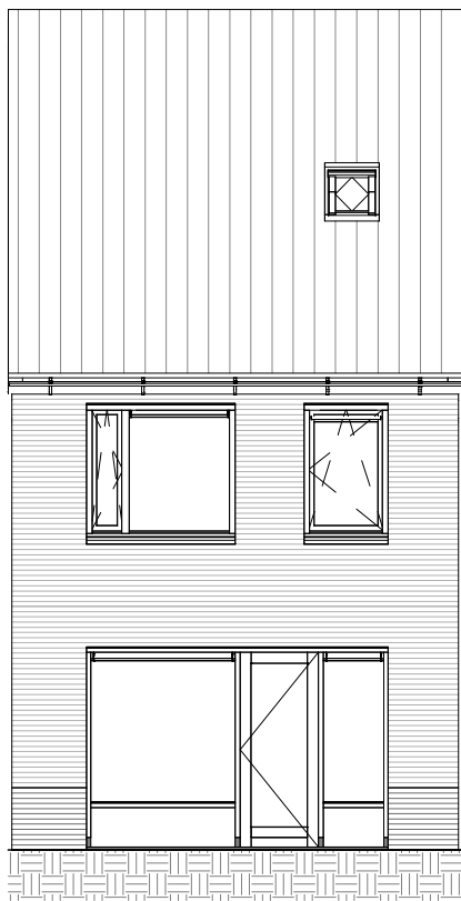
ACHTERGEVEL 1 : 100