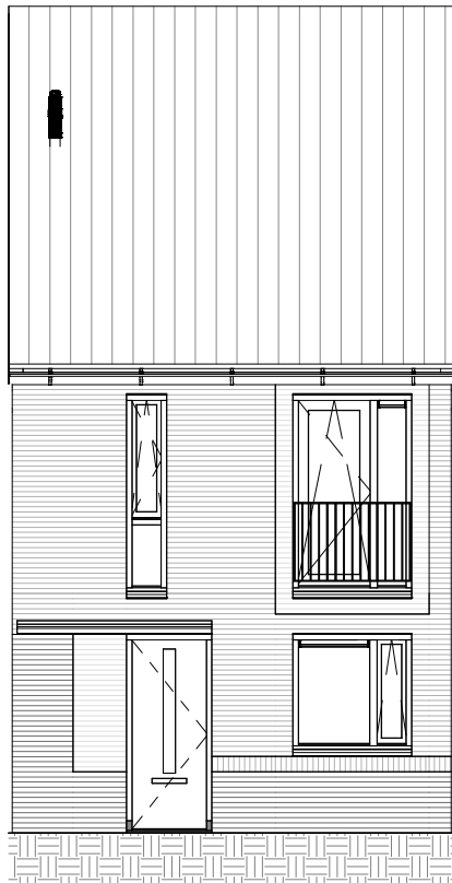
VOORGEVEL 1 : 100